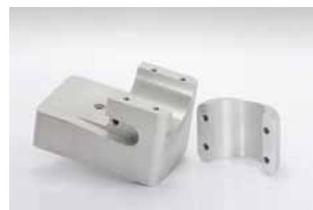
Schneidkopfhalterung, 2-teilig; 130x85x85mm; Aluminium (3.3206)