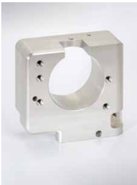
Brennerhalterblock, eloxiert; 125x117x53, Bohrung Ø70mm; Aluminium (3.3206)