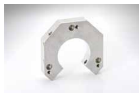
Zentrieraufnahme, eloxiert; 140x140x20mm Bohrung Ø70mm; Aluminium (3.3206)

Die vielseitigen Bearbeitungsmöglichkeiten machen uns zu einem Universal- und Speziallieferanten. Wir bearbeiten sämtliche Stahlsorten: unlegierte, niedriglegierte, hochlegierte und nichtrostende Stähle sowie auch alle NE-Metalle, z. B. Aluminium, Kupfer, Messing und Bronze. Auch die Palette von Kunststoffen liegt in unserem Fertigungsbereich.