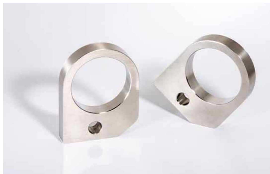
Lageraufnahme, geschliffen; 70x98x15mm; Edelstahl (1.4301)