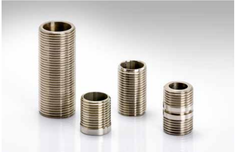
Anschweißnippel, versch. Ausführungen; Edelstahl (1.4301 – 1.4571)