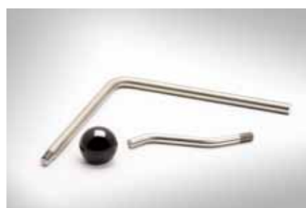
Griffstücke, gebogen und geschliffen, mit M10 Gewinde; Edelstahl (1.4301)