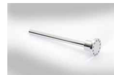
Achse (Ø15x218mm) mit aufgeschr. Flansch (Ø50x33mm); Messing (2.0550) geschl. u. verchr.