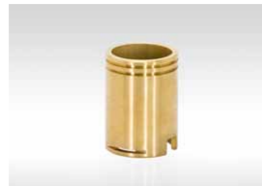
Achse mit Justiernut; Ø59,5x81mm; Messing (2.0401)