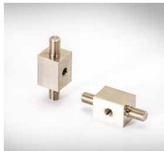
Justierstück mit M10x13mm; □22mm; Edelstahl (1.4301)

Modernste CNC-Technik sowie flexibel einsetzbare Spitzendreh- und Fräsmaschinen ermöglichen hochwertige Zerspanungsarbeiten. Bandsägeautomaten, Biegemaschinen, Revolverstanzen, allgemeine Werkstattmaschinen und Schweißanlagen erlauben wirtschaftlichste Fertigung vielerlei Werkstücke höchster Qualität.