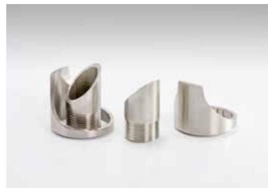
Auslaufnippel, versch. Ausführungen; Edelstahl (1.4301)