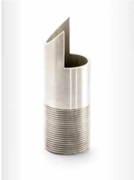
Rohrnippel mit Ausklüfung und Gewinde R1½"; Ø48,3x135mm; Edelstahl (1.4301)

Für das besondere Etwas oder die dauerhafte Beständigkeit arbeiten wir mit verschiedenen Betrieben zur Oberflächenbehandlung zusammen; denn Ihre Teile sollen einen bleibenden Eindruck hinterlassen. Ganz gleich ob geschliffen, poliert, hochglanzverchromt, trommelverzinkt, eloxiert oder lackiert, wir liefern Ihre Teile gemäß Ihren Vorgaben komplett bearbeitet und veredelt.