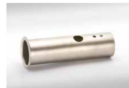
Abgasstutzen, Rand gebördelt; 54x2mm; Edelstahl (1.4301)