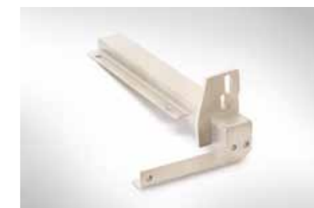
Baugruppe Scharnierlager, gefräst, gekantet und geschweißt; Edelstahl (1.4301)