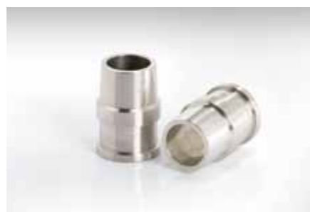
Standrohr; 45x65mm; Edelstahl (1.4301)